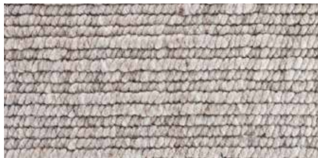
5107 sandy brown