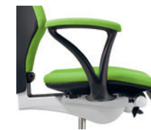
Vaste armleuningen bekleed Accoudoirs fixes rembourrés