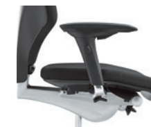
4D-armleuningen* onbekleed Accoudoirs 4D* non rembourrés