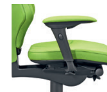
4D-armleuningen* bekleed Accoudoirs 4D* rembourrés

* 1D = hoogte verstelbaar réglable en hauteur 4D = hoogte-, breedte- en diepte verstelbaar réglable en hauteur, en largeur et en profondeur