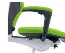
1D-armleuningen* bekleed Accoudoirs 1D* rembourrés