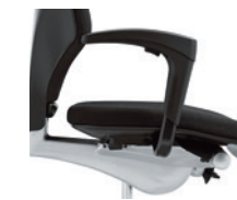
1D-armleuningen* onbekleed Accoudoirs 1D* non rembourrés