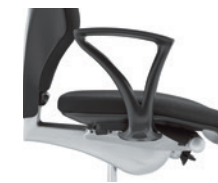
Vaste armleuningen onbekleed Accoudoirs fixes, non rembourrés

Toutes les possibilités de configuration vous sont proposées par le configurateur en ligne sur le site www.giroflex.com