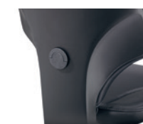
Diepte instelbare lendensteun Soutien lombaire réglable en profondeur

* 1D = hoogte verstelbaar réglable en hauteur 4D = hoogte-, breedte- en diepte verstelbaar réglable en hauteur, en largeur et en profondeur