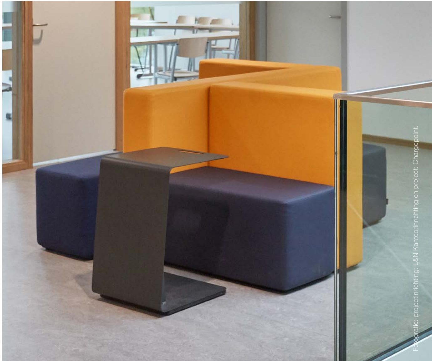
Fotografie: projectinrichting: L&N Kantoorinrichting en project: Chargepoint.