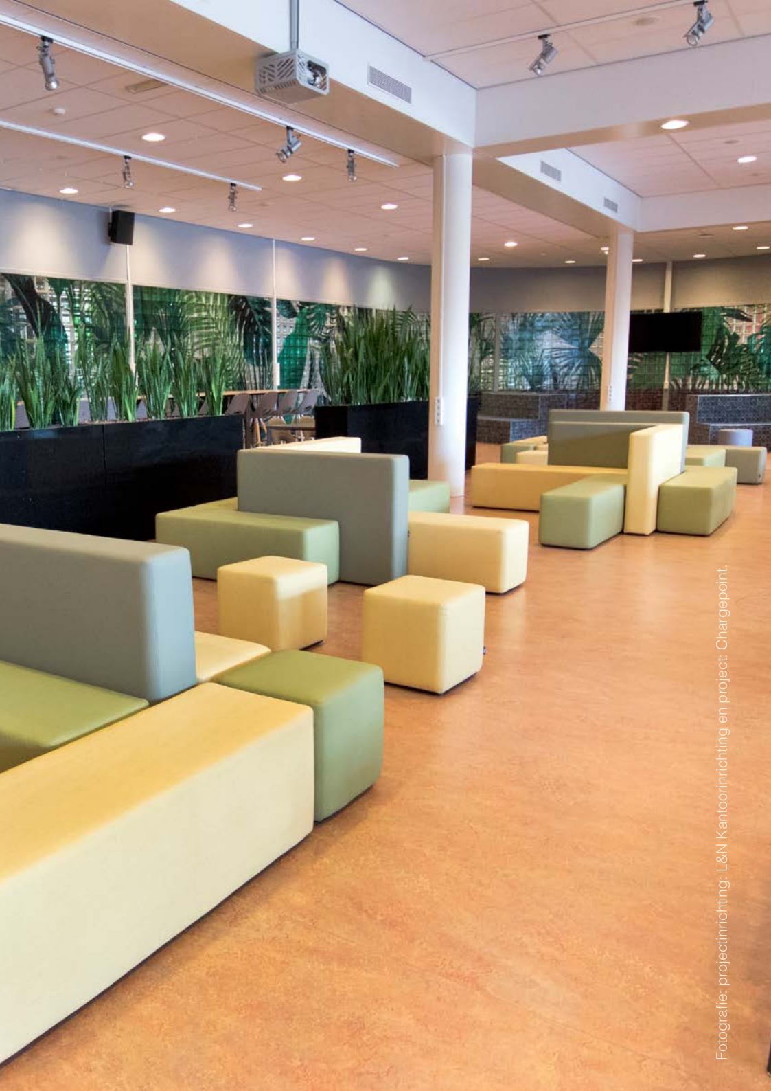
Fotografie: projectinrichting: L&N Kantoornrichting en project: Chargepoint.