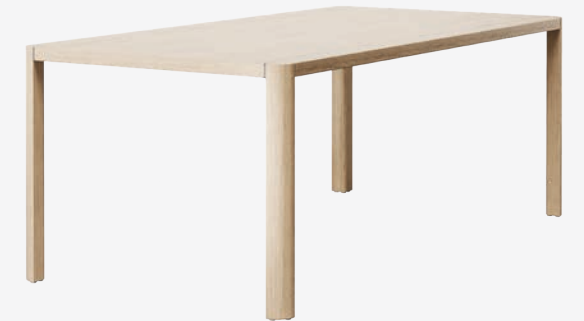
1140 TISCH/ TABLE 100 x 200 CM