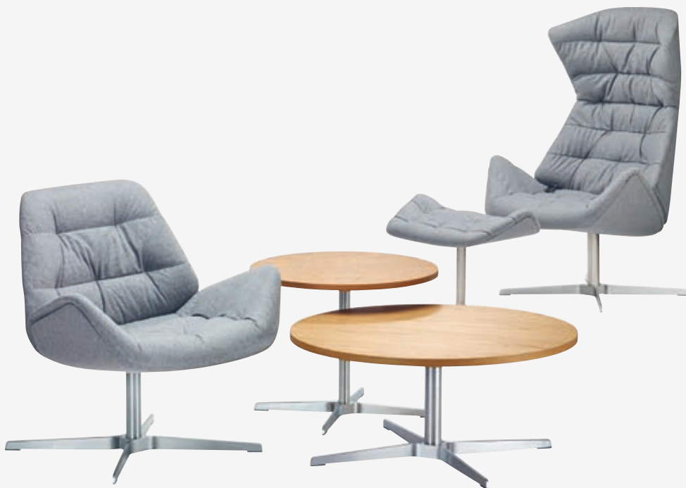
809, 1809, 1808 UND/AND 808 GESTELLE FLACHSTAHL EDELSTAHL OPTIK, POLSTERUNG, PLATTEN EICHE KLAR LACKIERT/ FRAMES FLAT STEEL STAINLESS STEEL DESIGN, UPHOLSTERY, TABLETOPS OAK CLEAR LACQUERED

The compact lounge chair 809 functions as a “small brother” of the successful lounge chair 808, and as a place of retreat in smaller rooms or in groups, and in combination with the larger chair or the low side tables 1808 and 1809. A footstool rounds off the range.