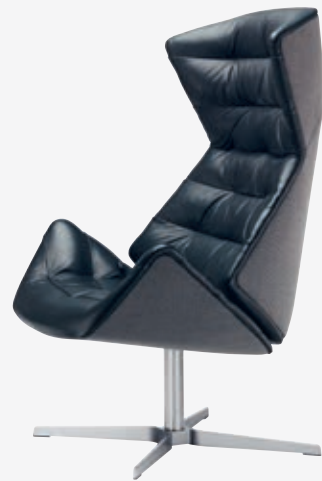
808 GESTELL FLACHSTAHL EDELSTAHOPTIK, POLSTERUNG/ FRAME FLAT STEEL STAINLESS STEEL DESIGN, UPHOLSTERY