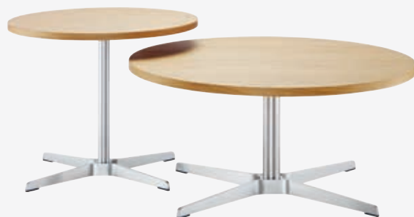
1808 TISCH NIEDRIG/TABLE LOW 1809 TISCH HOCH/TABLE HIGH GESTELLE FLACHSTAHL EDELSTAHOPTIK PLATTEN EICHE KLAR LACKIERT/ FRAMES FLAT STEEL STAINLESS STEEL DESIGN, TABLETOPS OAK CLEAR LACQUERED