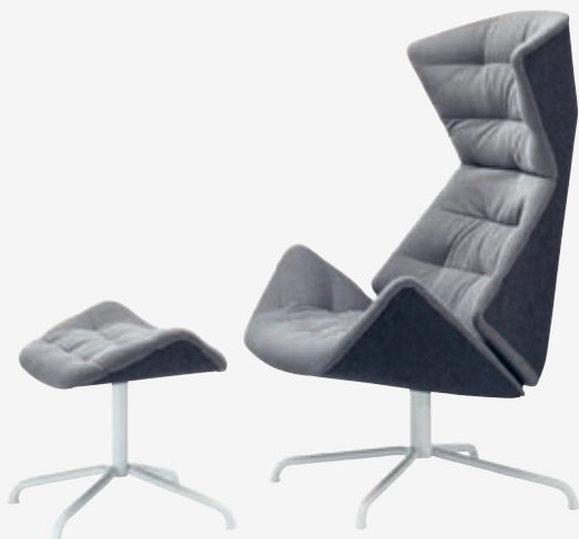
808 H UND/AND 808 STAHLROHRGESTELL, POLSTERUNG/ TUBULAR STEEL FRAME, UPHOLSTERY