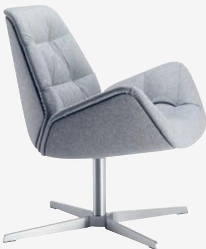
809 GESTELL FLACHSTAHL EDELSTAHOPTIK POLSTERUNG/ FRAME FLAT STEEL STAINLESS STEEL DESIGN, UPHOLSTERY