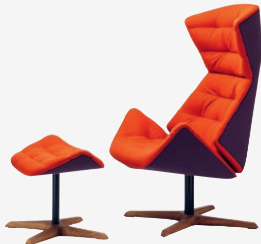
808 H UND/AND 808 GESTELL NUSSBAUM GEÖLT, POLSTERUNG/ FRAME WALNUT OILED, UPHOLSTERY